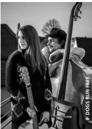
IF DOGS RUN FREE